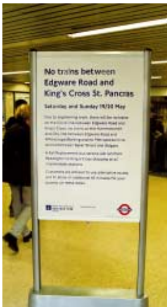
Lehké přenosné informační panely ve vestibulech stanic: informace o krátkých výlukách provozu na příslušné lince, včetně eskalátorových údržbových prací (estetická a účinná informace).

LU odhaduje, že 60% zpoždění dotýkajících se cestujících v metru (měřená jako celkový počet minut ztracených celkovým počtem pasažérů při zpožděních dvě minuty a více) jsou způsobována poruchami infrastruktury a na vozovém parku a připisována z velké míry nedostatku investic. Nedostatek financování údajně též přispěl ke vzniku atmosféry, ve které permanentní nedostatek zdrojů vedl k neodpovídajícím mana-