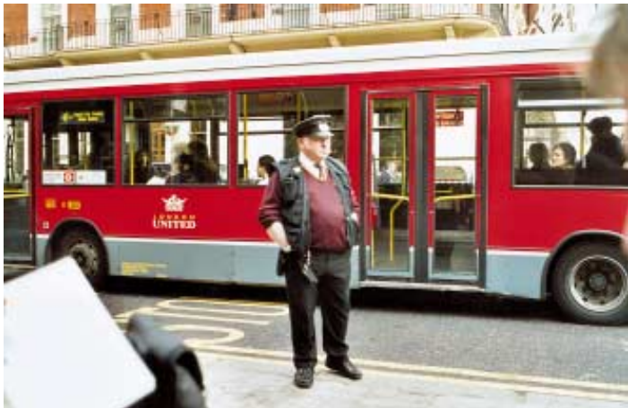
Pickwickovský dispečer na zastávce autobusu u Gloucester Road Station. Marně nedělní čekání na příjezd okružního vyhlídkového autobusu

Současná roční hodnota těchto smluv, z nichž 20% je každý rok dáváno do nových