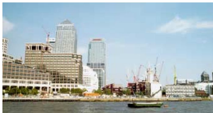
Canary Wharf je hlavním „business“ centrem nových „Docklands“, vzdálených 3 míle na východ od Bank of England v londýnském City. Denně v něm dnes pracuje 41 tisíc, za pět let to má být 90 tisíc zaměstnanců.

V roce 2004 se počítá s nárůstem na 60 milionů cestujících. Proto se připravuje zdvojnásobení kapacity v průběhu příštích čtyř let nákupem nových souprav, novou