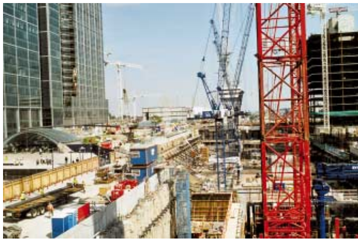
Stavební „boom“ v okolí stanice Canary Wharf, vstup do stanice na levé straně obrázku.

Tento technicky inovativní projekt byl navržen jako hospodárné řešení k podpoře regenerace dříve zpustlých oblastí doků ve východním Londýně, které měly velmi špatnou obsluhu veřejnou dopravou. Původně 12 kilometrů dlouhá linka byla brzy prodloužena do Bank City v roce 1991, do Becktonu v roce 1994 a v nedávné době pod řekou Temží do Greenwiche a Lewishamu v listopadu 1999. V současnosti je DLR 26 km dlouhá.