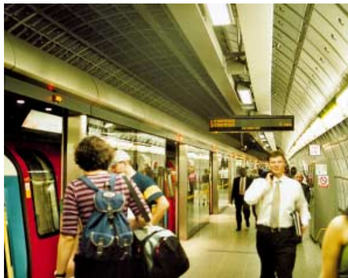
Bezpečnostní stěna se synchronizovanými dveřmi ve stanicích Jubilee Line.

Až do roku 1984 kombinace přikázaných poplatků a státních dotací tvořila přibližně polovinu příjmu LU a zbytek byl tvořen příjmy z jízdného. V roce 1984 ústřední vláda přijala odpovědnost za financování metra a od té doby, obzvláště v první polovině devadesátých let, podíl státních dotací na celkovém financování metra dramaticky klesal. Od poloviny devadesátých let státní dotace pro LU pouze kryly náklady na údržbu systému.