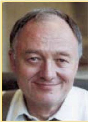
Primátor Londýna Ken Livingstone

Kongres, na němž byla očekávána rekordní účast kolem 10 tisíc delegátů a návštěvníků, byl příležitostí k vyslechnutí přednášek odborníků z celého světa. Organizátoři usnadnili volbu a možnost účasti na nejzajímavějších prezentacích tím, že pouze první ranní a první odpolední přednášky se konaly ve dvou souběžných sekcích, druhé dopolední a odpolední sekce již probíhaly samostatně. Kongres byl na výstavišti v Earls Court ve čtvrti Chelsea doprovázen výstavou pod názvem „Mobilita a městská doprava“, kde na ploše 20 tisíc m 2 své výrobky představilo téměř 250 vystavovatelů. Hlavní stánky patřily firmám Adshel, Alstom, Bombardier, J. C. Decaux, Mercedes, Michelin, National Express, SNCF – Francouzské železnice, Scania, Volvo a dalším, ale přítomny svými expozicemi byly i velké dopravní podniky jako RATP, dále města či regiony, z nichž nový regionální plán dopravy představil Region Brusel – hlavní město, národní dopravní svazy jako VDV – Svaz německých dopravních podniků či francouzský UTP – Svaz veřejné dopravy, či četní další menší dodavatelé a konzultační kanceláře v oblasti dopravy z různých evropských i zámořských zemí.