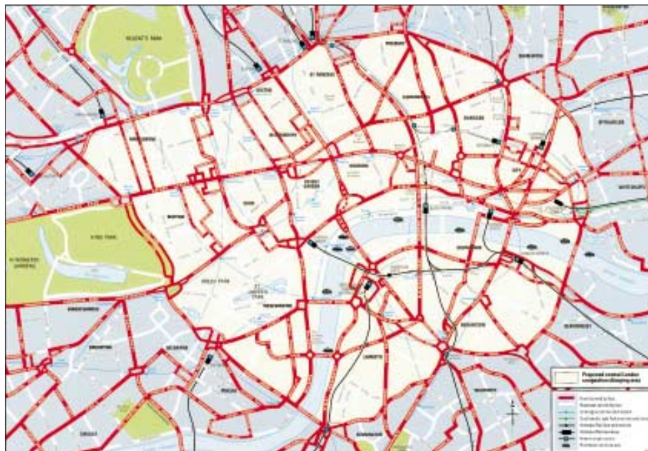
Navrhovaná londýnská oblast mýtného za zácpy, vymezená vnitřním okruhem (Inner Ring Road)

by poplatek činil 10 £. Existuje výčet vozidel se 100% slevou, rezidenti by měli 90% slevu.