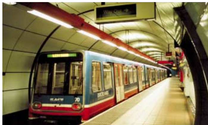
Souprava DLR ve stanici.

DLR nyní stojí na prahu období obdobného růstu, a nová prodloužení vyžadují pečlivé plánování. Pan Brown si 21. narozeniny DLR v roce 2008 představuje jako systém plně integrovaný do ostatní sítě londýnské veřejné dopravy s vysoce kvalitním vozovým parkem a s výkonem 80 milionů cestujících za rok.