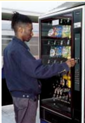
Prodejní automat na nástupišti stanice metra – co vyšší příjmy od cestujících jako zákon.

Osobní bezpečnost cestujících ve stanicích, na nástupišťích, v soupravách, na parkovištích u stanic a v okolí stanic je pro cestující velmi důležitá, obzvláště pro ženy. Průzkumy cestujících ukazují, že vyšší přítomnost zaměstnanců by byla nejvíce vítaná odpovědí na tyto obavy. To by mělo zahrnovat i přírůstek počtu příslušníků britské dopravní policie.