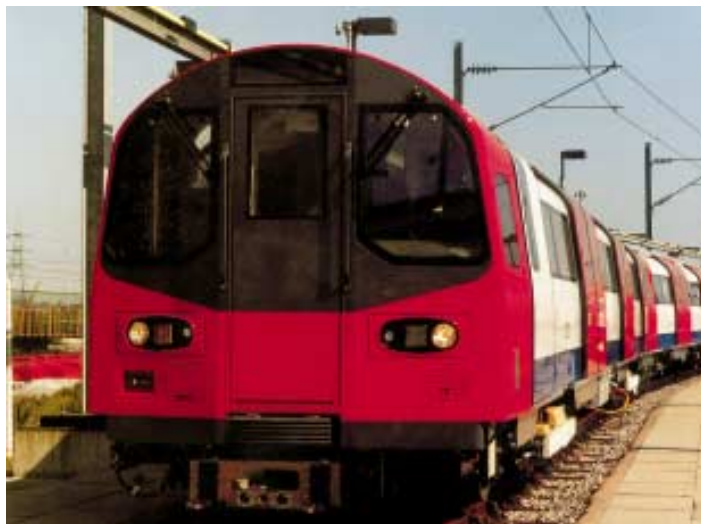
Nové soupravy metra pro Northern Line z roku 1997, dodané a udržované výrobcem Alstom, jako výsledek pionýrské smlouvy pod tzv. Private Finance Initiative – finanční iniciativou soukromého sektoru.

pod požadovanou úroveň. Je silně přetížené a nespolehlivé. Zpoždění jsou stále častější a delší. V důsledku neodpovídajícího investování a údržby po dlouhou řadu let běžně dochází k poruchám na vybavení, na signalizaci, elektrickém napájení, eskalátorech a vozových soupravách. V důsledku toho dochází v metru k poklesu mnoha ukazatelů kvality služby.