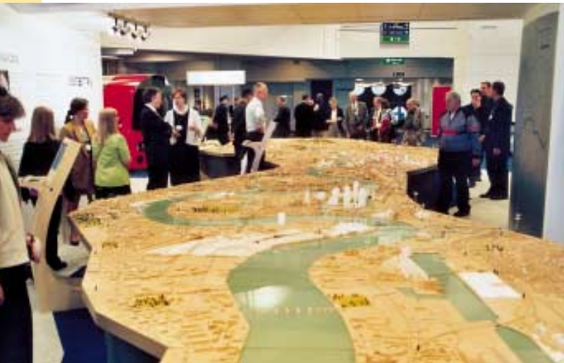
Stánek Transport for London a model Londýna – bíle vyznačena rozvojová území

V projevech i materiálech hostitelské organizace bylo možné nejdříve slyšet či číst o kritické situaci londýnského dopravního systému. Ptáte-li se, proč přesto byl londýnský systém veřejné dopravy ve spotřebitelském testu ADAC (viz DP-KONTAKT č. 5/2001) vyhodnocen na vynikajícím 3. místě z 20 evropských velkoměst, pak mohou poskytnout odpověď založenou na vlastní zkušenosti: protože ADAC nemohl opominout všudypřítomnou nefalšovanou a o profesionální marketingovou základnu opřenou snahu vyjít klientovi vstříc v informování, přijetí a v celkovém vytváření přátelského klimatu.