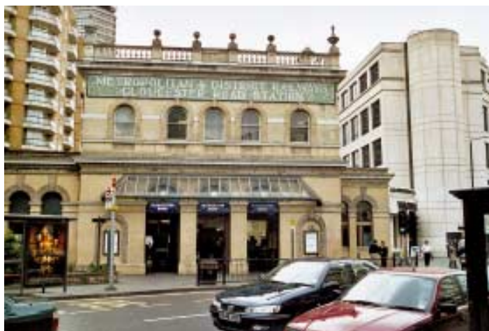
Gloucester Road Station je jedním z nejlépe dochovaných příkladů stanic metra z půle Viktoriánské epochy. Neoklasicistní styl budov byl uplatněn pro všechny stanice prodloužení linky Metropolitan Railway, uvedeného do provozu roku 1868. Stanice dnes patří mezi památkově chráněné budovy.