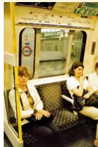
Interiér vozu metra s vřadypřítomnými schémata sítě a linek nad okny a pohled vně na logo s názvem stanice: umístění loga, jehož počátky se datují od roku 1908, stále plně vyhovuje smyslu požadavků příští evropské normy kvality služby ve veřejné dopravě (viditelnost názvů stanice ze všech bodů soupravy)