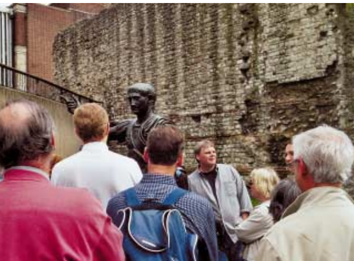
Dobyvateli Anglie Césarovi je pro zjevný civilizační přínos Říma stále pozorně nasloucháno

Underground – Londýnské metro, je partnerem naší společnosti v rámci evropského výzkumného projektu Prismatica , zabývajícího se bezpečností v městské veřejné dopravě.