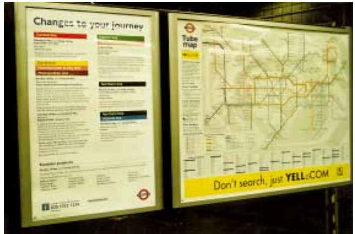
Informační panely ve stanicích metra: vpravo schéma sítě, vlevo změny v provozu na jednotlivých linkách.

Podle Strategie musí být finanční plán spolehlivým, konzervativně strukturovaným programem, který bude zajišťovat stabilní, předvídatelné financování nezbytné k obnově metra a k pečlivě udržovanému stavu. Vychází z přístupů, které se osvědčily