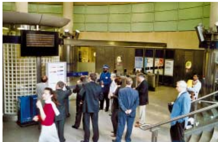
Momentka z exkurze na Jubilee Line za asistence Customer Care Asistenta – pomocníka pro péči o klienty v modré uniformě ve vstupním vestibulu (nové turnikety, klasičké a elektronické informace, průměrně 100 kamer na jednu stanicí).

žerským praktikám, snížil aspirace managementu a vedl ke vzniku kultury, která nedostatečně reaguje na potřeby cestujících.