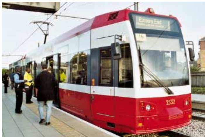
Souprava Croydon Tramlink v zastávce.