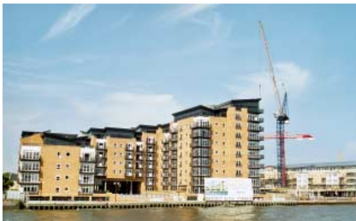
Nová obytná výstavba v Docklands – pohled z Temže.

DLR jako kolejová doprava s automatickým provozem byla pionýrem v zavádění doprovodného personálu, tzv. Passenger Service Agents. Tímto přístupem se podařilo snížit stupeň vandalizmu a též zajistit příznivé vnímání této rychlodráhy veřejností. K tomu přispívá rozšířený kamerový dohled a již zmíněný rozsáhlý stupeň informování.