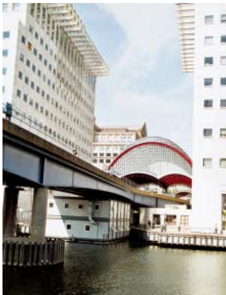
Viadukt se stanicí DLR Canary Wharf.

infrastrukturou a zvýšenou úrovní signálního systému. Všechny soupravy DLR jsou tvořeny šestinápravovými kloubovými vozidly, které jezdí buď samostatně nebo spojeny do dvojice. Dalších 24 vozových souprav je ve výrobě v závodě Bombardier v Bruggách, kde byl postaven i současný vozový park 70 vozidel. Nová vozidla jsou založena na původním vozovém parku, ale budou odpovídat nejnovějším standardům pro přístup vozíčkářů a pro usnadnění přístupu nevidomých, neslyšících a lidí se sníženou pohyblivostí. Hlavním klíčem pro expanzi DLR je jeho pohyblivá bloková signalizace, zahrnující jeden z nejbezpečnějších ATP systémů, který pomůže ke snížení intervalů.