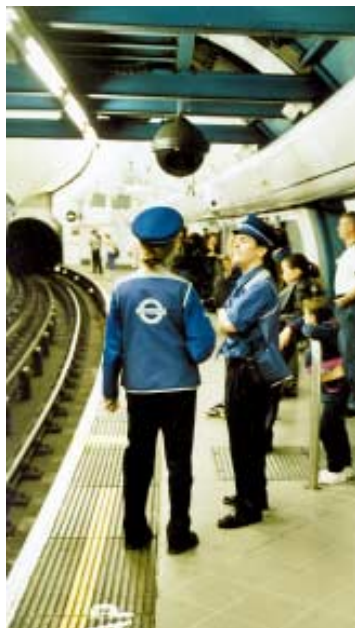
Train Service Assistants – asistenti(tky) vlakové služby: jejich hlavním úkolem je zajišťování bezpečného a plynulého nástupu do souprav ve špičkách. Jejich pracovištěm jsou nástupiště, často v oblouku a proto s všudypřítomným Mind the Gap – pozor na mezeru.

London Underground průběžně zvyšoval celkovou nabídku vozíků, ale k tomuto nárůstu docházelo především mimo špičky. Zlepšování stavu linek dává na-