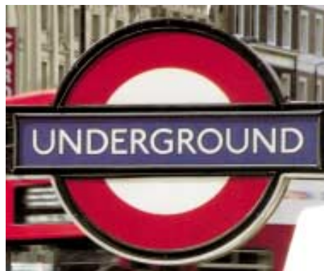
Logo Metro Londýn

Jako páteř osobní dopravy slouží metro obyvatelům města k dopravě do zaměstnání, za nákupy i k aktivitám ve volném čase a využívá jej přes 90% turistů navštěvujících Londýn. V provozu je 20 hodin denně. Je velmi jednoduché se v něm orientovat (každá linka má svou barvu a své jméno) a dostat se jím ke všem hlavním městským zajímavostem.