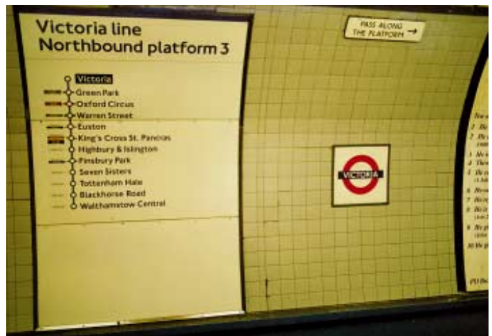
Stanice Victoria na Victoria Line: na stěně v kolejisti, vedle sebe, orientační panel, logo metra s názvem stanice a vpravo výřez panelu o poselství Ježíše.