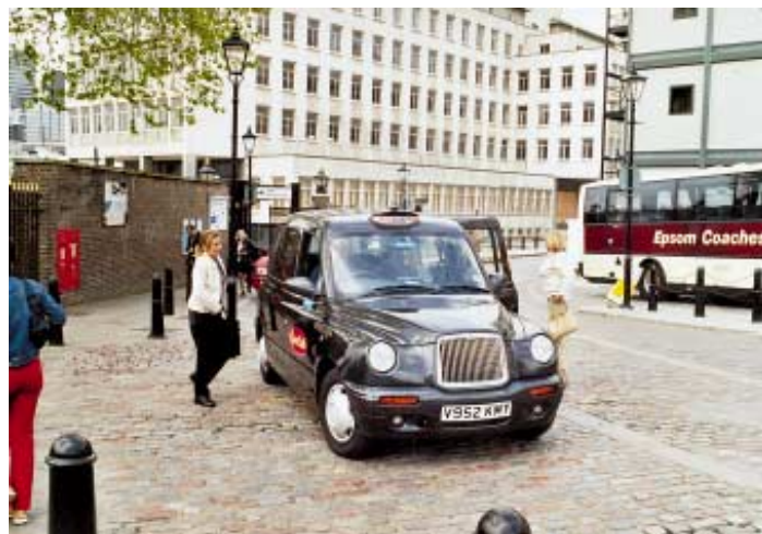
V současnosti jezdí, převážně v centrálním Londýně a na letišti Heathrow, kolem 20 tisíc taxíků s licencí (tzv. black cabs). Přes nejmodernější vybavení vozů doznala tradiční karoserie minimálních úprav. Dále v Londýně jezdí na 40 tisíc tzv. minicabs dosud bez licence.

Po všeobecných volbách v roce 1997 došlo ke změně v místní správě Londýna. Byl vytvořen nový, z přímé volby vzešlý Greater London Authority – Úřad Velkého Londýna (GLA) s přímo voleným primátorem, který převzal zodpovědnost za správu Londýna od různých místních úřadů, uplatňujících své pravomoci od roku 1984. Mezi různými úkoly převzal GLA též řízení celé londýnské dopravy pod střešovou organizací, kterou je Transport for London. TfL zodpovídá od 3. července 2000 za plánování a zajišťování veškeré dopravy v Londýně a zabezpečování její integrovanosti. TfL je řízena představenstvem jmenovaným primátorem Londýna, který instituci nastupující po London Transport též předsedá. TfL je v současnosti zodpovědná za bývalý LRT (kromě LUL) a též za taxíky, DLR, správu komunikací a říční dopravu. London Underground nebyl v tomto stádiu do TfL převeden, protože si vláda přála, aby její projekt Public Private Partnership (dále PPP), s cílem přinést zvýšené kapitálové investice do tohoto systému, byl dokončen před uskutečněním transferu.