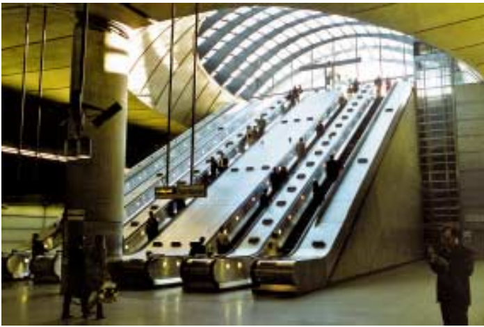
Působivá architektura stanice Canary Wharf v centru Docklands, Jubilee Line.