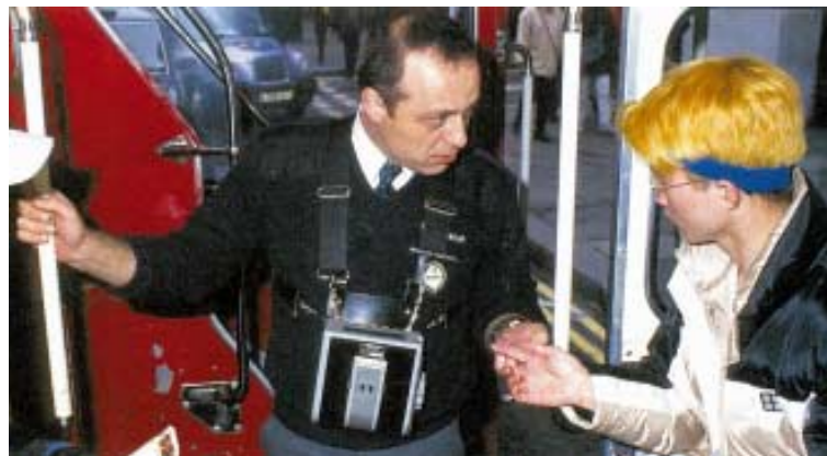
Výběřčí v doubledeckeru.