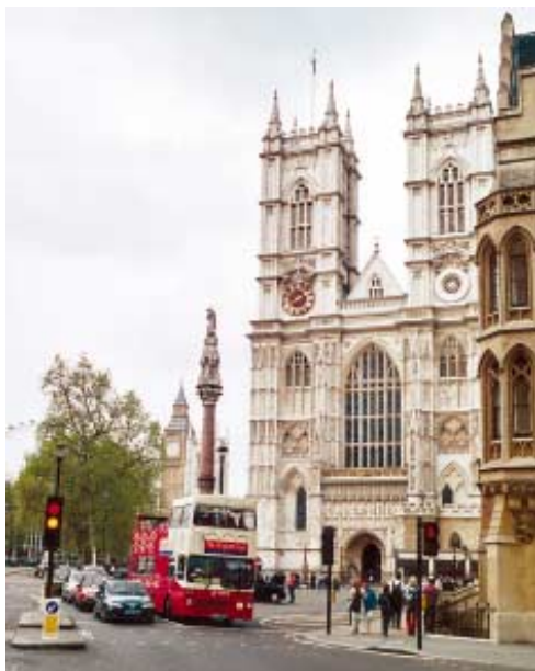
Westminsterská katedrála v pozadí s věží Big Ben, vpředu vyhlídkový doubledecker

Úkolem Transport for London je tuto dopravní strategii realizovat a řídit následující dopravní systémy, za které primátor zodpovídá: